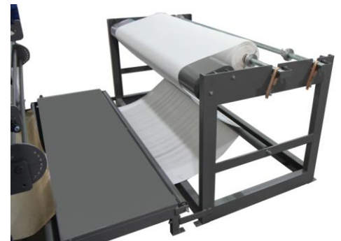
Fabric entrance detail Detalle de la entrada de tejido