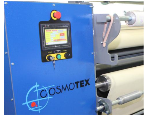
Control panel touch screen Panel de control con pantalla táctil