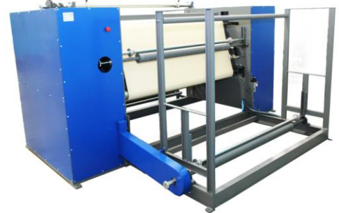
Back view of the machine Vista posterior de la máquina